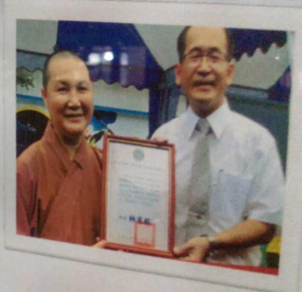
「財團法人佛光山文教基金會優良圖書捐贈台東戒治所活動」，6/28 與台東戒治所